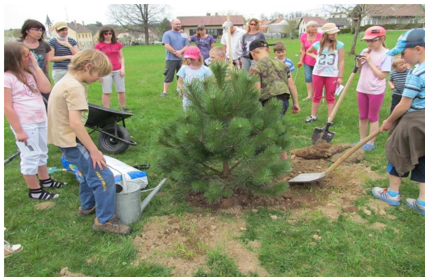
Společné sázení borovice černé — Den Země 2013