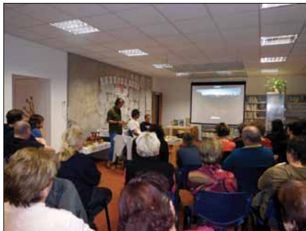
Republikou křížem krážem