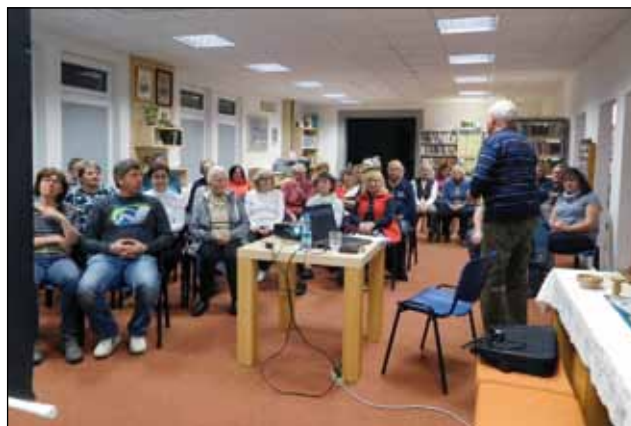
Historie psaná vodou