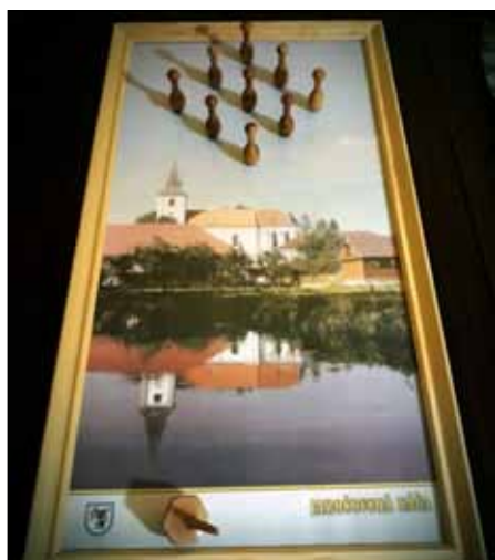
Nejnovější stůl a káča s figurkami Na turnaje přijíždí hráči ze širokého okolí