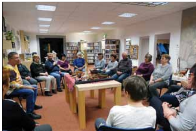
Cesty za poznáním