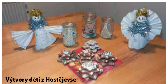
Výtvary dětí z Hostějevse