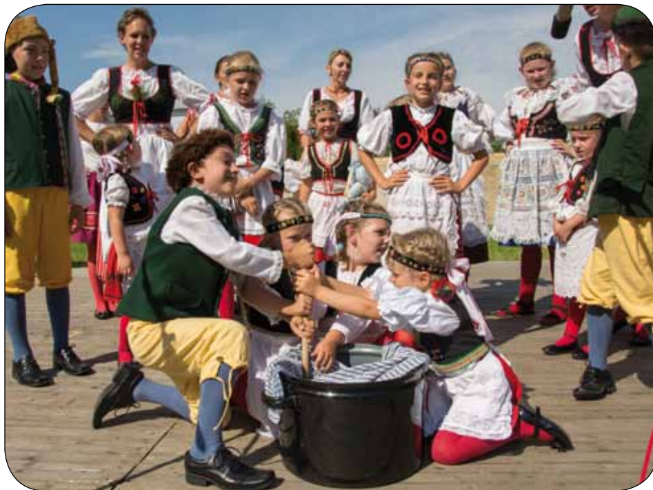
10. ročník folklorního festivalu v J. Hradci.