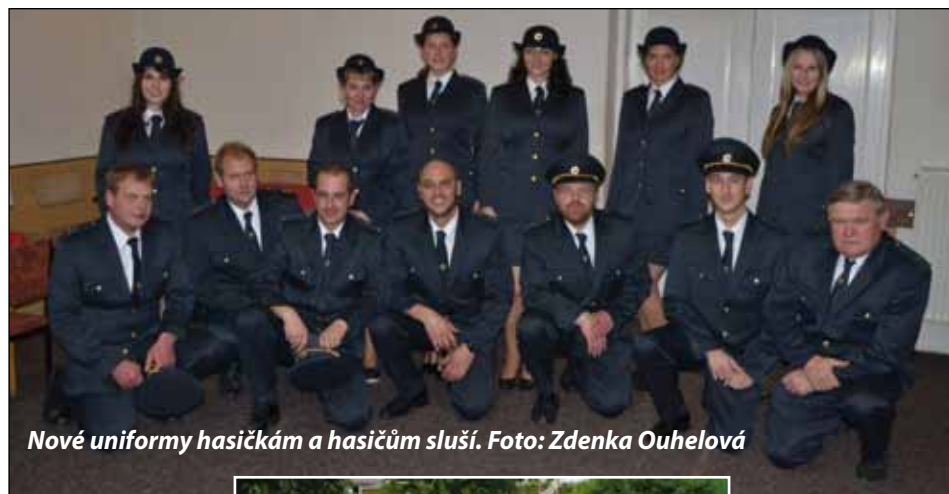
Nové uniformy hasičkám a hasičům sluší.

Ples je tentokrát naplánovaný na 6. ledna, k poslechu a tanci bude hrát tradičně Klaret a připravená bude i bohatá tombola. vvr