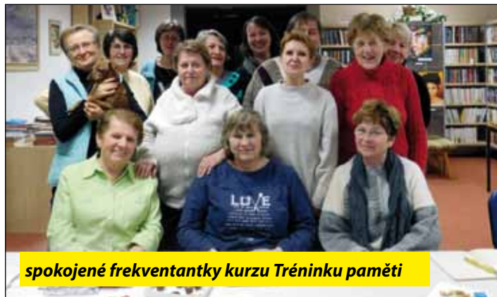
spokojené frekventantky kurzu Tréninku paměti