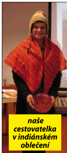
naše cestovatelka v indiánském oblečení