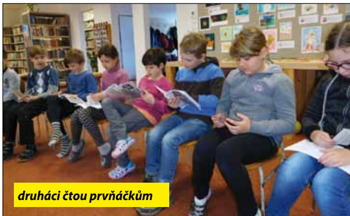
druháci čtou prvňáčkům