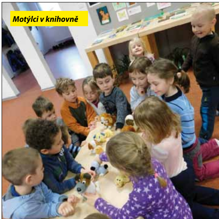
Motýlci v knihovně