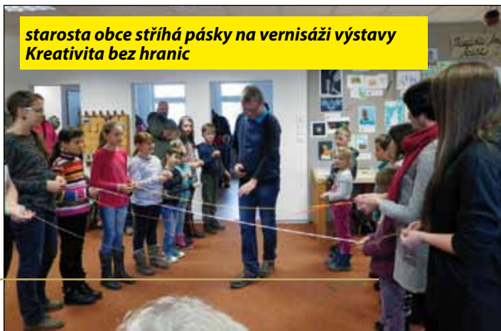
starosta obce stíhá pásky na vernisáži výstavy Kreativita bez hranic