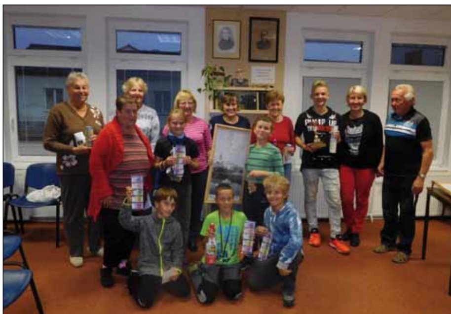
ocenění účastníci Bleskového turnaje v Káče