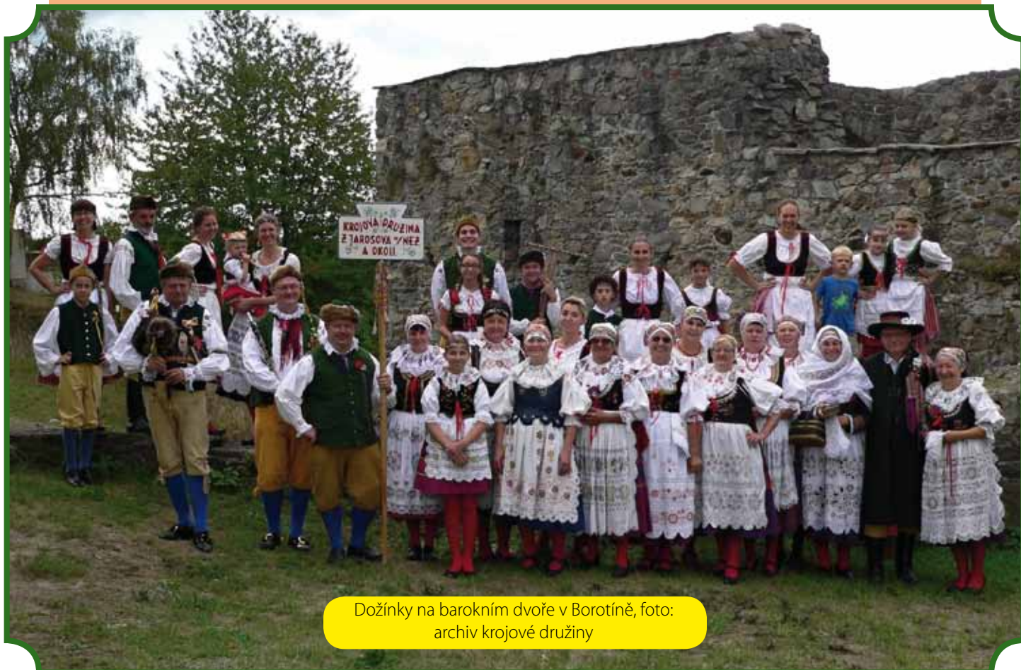
Dožínky na barokním dvoře v Borotíně