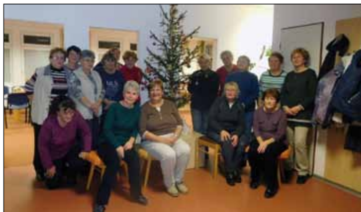
zdobení stromečku, vánoční čtení a zpěvy