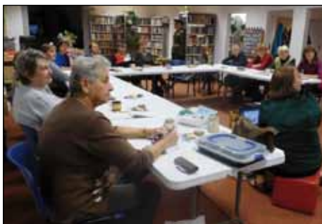
účastnice říjnového Mozkobraní

První říjnový týden se každoročně odehrává celostátní akce Týden knihoven. Pravdova knihovna se do něj letos zapojila tím, že zahájila podzimní část oblíbeného kurzu trénování paměti, tentokrát pod názvem Mozkobraní. Po pět úterních večerů se pak pravidelně scházelo 14 – 16 účastnic kurzu na jednotlivých lekcích s oblíbenou lektorkou Olgou Šenoldovou.