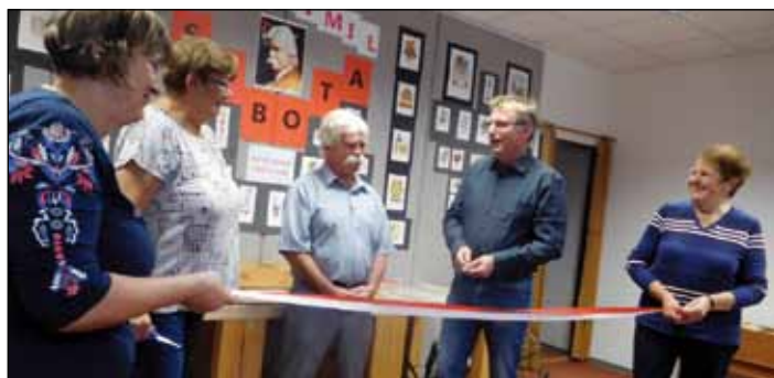
slavnostní stříhání pásky