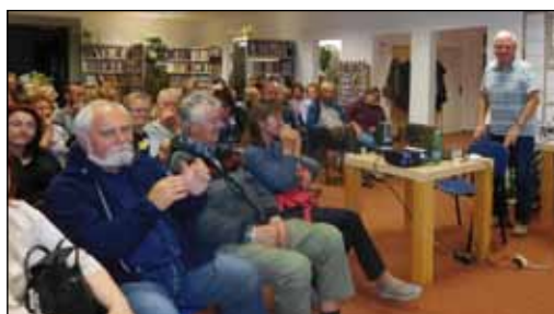
seznámili jsme se s Novohradskem