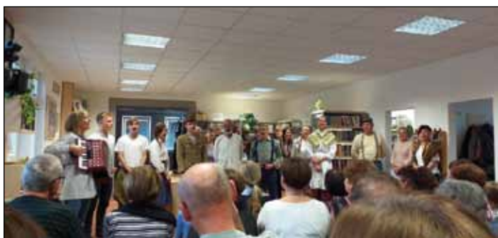
finále vzpomínkového pásma Válečné ozvěny