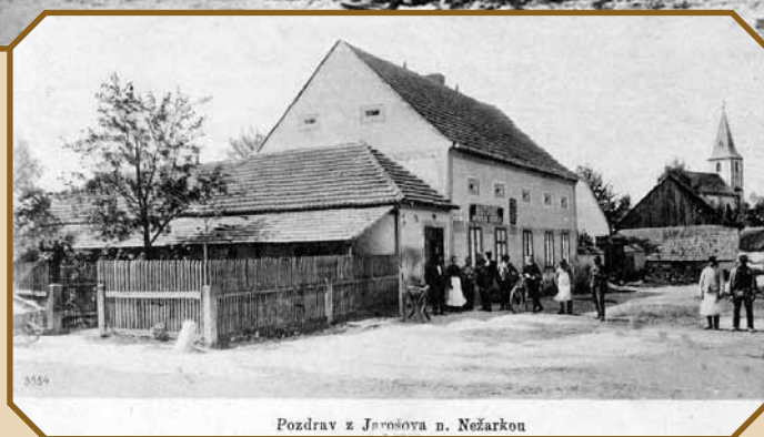
Pozdrav z Jarošova n. Nežarkou