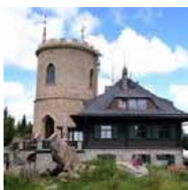
Rozhledna Klet' v Blanském lese