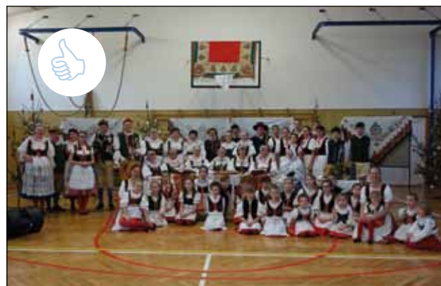
30.11. Zahájení adventu Jarošovskou Krojovou Družinou ☺