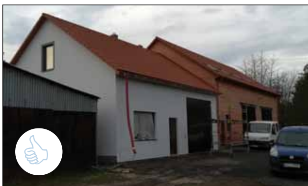
19.11. Dokončení venkovních omítek na víceúčelové budově v Hostějvsi ☺