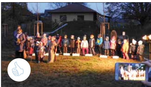
11. 11. Oslava Dne Svatého Martina v Mateřské školce ☺