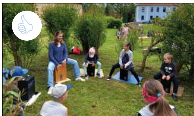
1.6. ZŠ, MŠ Jarošov nad Nežárkou a SDH Jarošov nad Nežárkou uspořádali Dětský den v areálu Srdce Jarošova. 😊