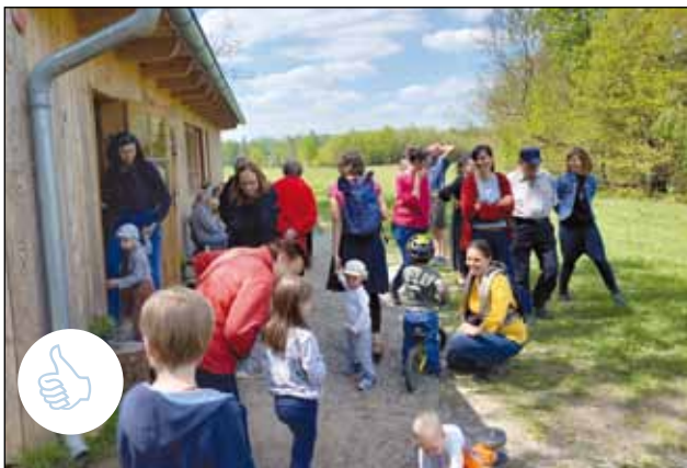
9. 5. Proběhl Den otevřených dveří v luční školce na Kruplově. Děkujeme za prohlídku. 😊