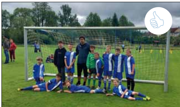
1.6. TJ Sokol Jarošov nad Nežárkou uspořádal Dětský fotbalový miniturnaj. 😊