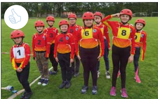
18. 5. V požární soutěži Plamen vyhráli naši nejmladší hasiči 1. místo z osmi soutěžících. Jejich starší kolegové se umístili na místě osmém z 11. soutěžících. Blahopřejeme a děkujeme jejich vedoucím za vzornou přípravu hasičských sotníků. 😊