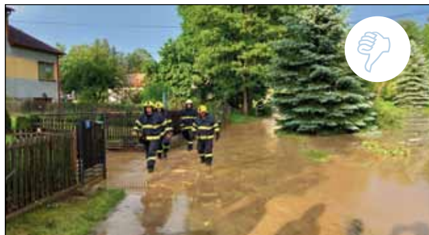
27. 5. SDH Jarošov nad Nežárkou vyjždělo k zatopené místní komunikaci v Nekrasíně. Zde a v Jarošově nad Nežárkou se také přehnalo krupobití, které způsobilo škody zejména na zahradách. ☹️