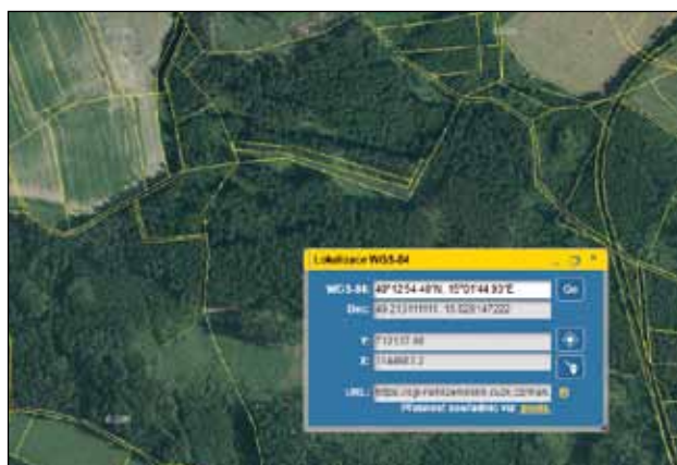
Západ 49°12'54.40"N, 15°01'44.93"E – Lovětín parc. č. 379