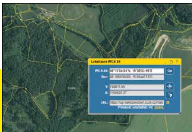
Jih 49°10'04.94"N, 15°05'03.96"E – Matějovec parc. č. 221