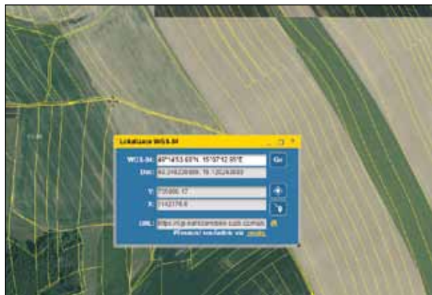
Sever 49°14'53.66"N, 15°07'12.95"E – Zdešov parc. č. 386