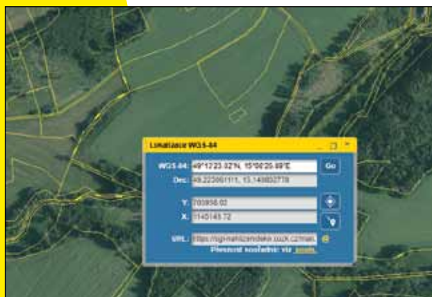
Východ 49°13'23.02"N, 15°08'26.89"E – Zdešov parc. č. 96